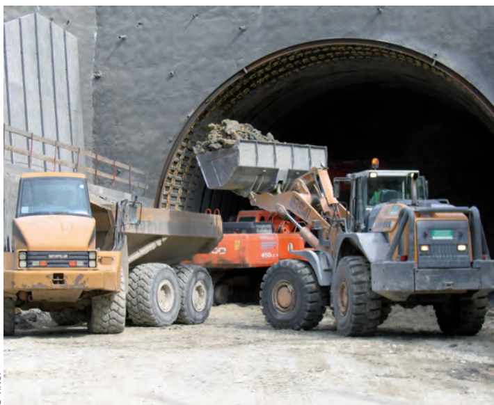
Une partie du « marinage » sera utilisée pour la future chaussée du tunnel routier.

Faire du développement durable chaque fois que c'est possible : tel est le credo du groupement d'entreprises lauréat du projet.