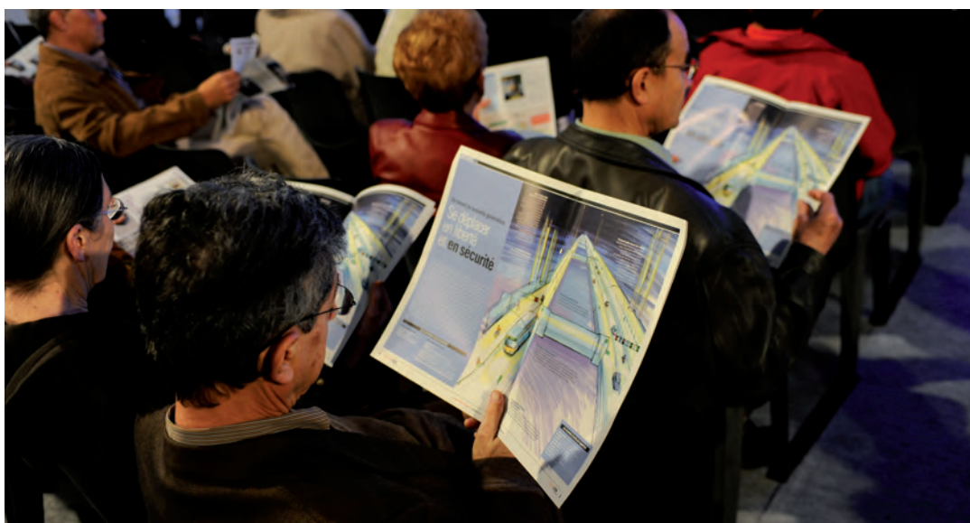
Réunion publique du 24 mars 2010.

Sur tous ces sujets, la vigilance et les propositions des participants ont été très précieuses.