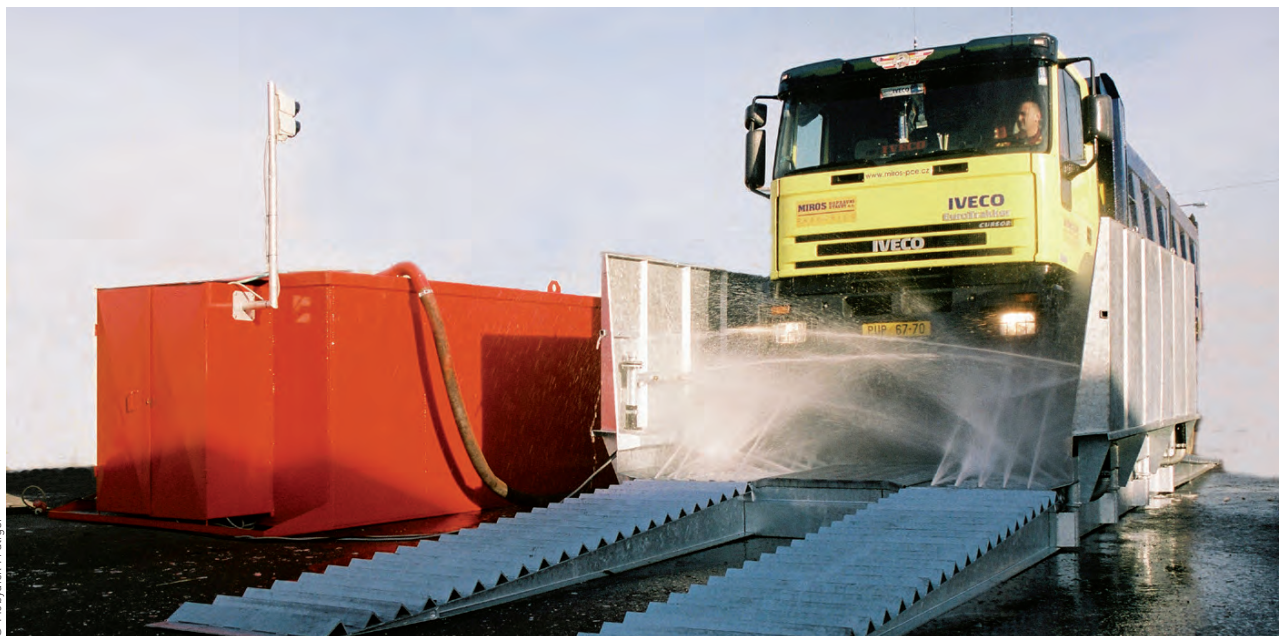
Un débourbeur nettoie systématiquement les roues des camions quittant le chantier.

D ans un environnement urbain de centre-ville au niveau de pollution déjà important, l'un des défis des entreprises de construction est de maîtriser les rejets polluants du chantier. C'est dans ce but que plusieurs initiatives ont été prises pour