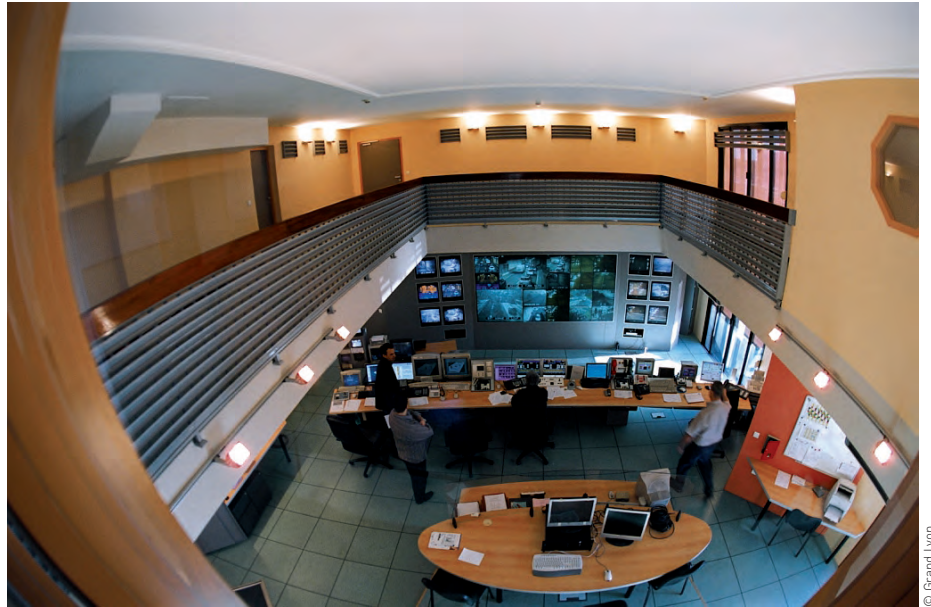
Les postes de contrôle des tunnels lyonnais centralisent toutes les remontées d'informations nécessaires à leur exploitation.

Quelles que soient la performance de ses équipements et la compétence de ses agents, aucun tunnel routier n'est cependant à l'abri d'un accident ou d'un incendie. Le jour où un tel événement se produit, il faut être en mesure de réagir, avec des mesures appropriées prises rapidement. Voilà pourquoi la mission du service des tunnels lyonnais comporte aussi l'élaboration de procédures d'urgence, et des exercices de simulation qui permettent par anticipation de préparer les équipes à un